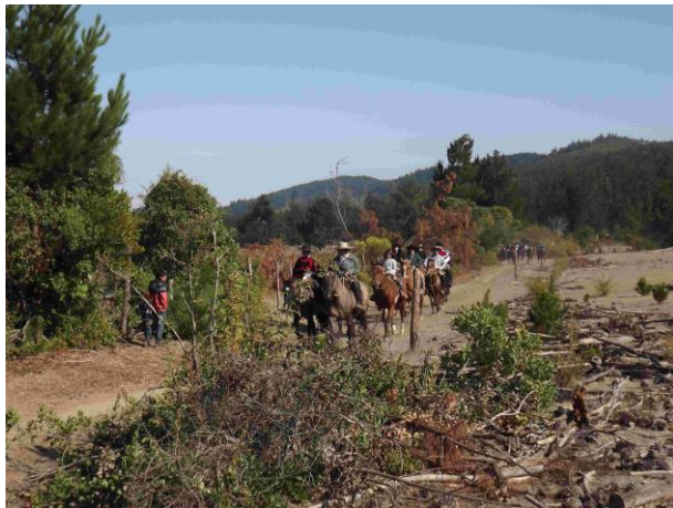
Figura N° 8 Cabalgata de Empedrado.

El recorrido a caballo consta de un día de recorridos por caminos sinuosos, bosque nativo y de pinos, dejándose ver paisajes y lugares desconocidos por los vecinos y turistas que participan cada año ( https://bit.ly/3chfusR ).