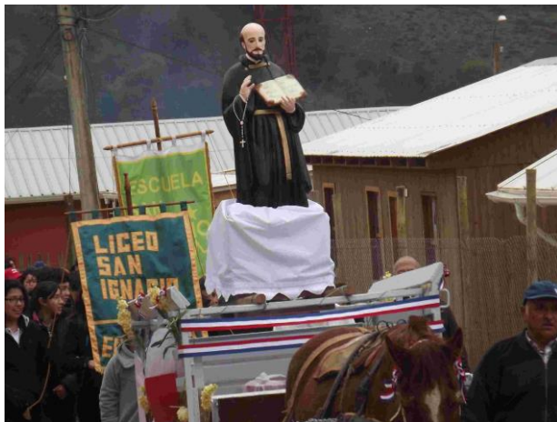
Figura N° 10 Celebración de San Ignacio de Loyola, Empedrado.

En julio se realiza la tradicional procesión que comienza en la plaza de armas de Empedrado, donde se celebra a San Ignacio de Loyola, reuniendo a toda la comunidad y finalizando con integrantes del Club de Cueca San Ignacio que realizan un esquinazo en honor al Santo Patrono de Empedrado ( https://bit.ly/3badnHI ).