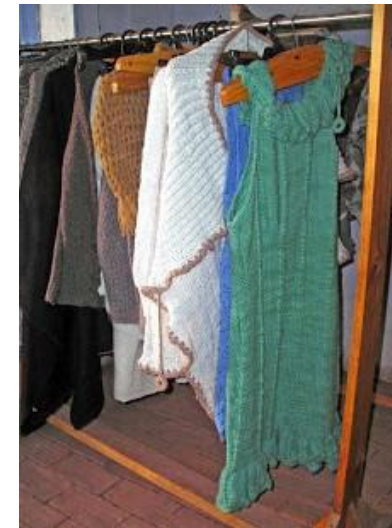
Figura N° 3 Tejidos de Quenehuao, Empedrado.

industria elabora 36 toneladas anuales de lana, ya sea de alpaca, oveja o una combinación de ambas. En ella laboran cinco trabajadores en forma permanente. Las actividades de producción consisten en la compra de lana en bruto, su procesamiento y posterior venta como lana de distintas calidades, donde se incluye la prestación de servicio de depurado, limpieza de lana para productos externos y la venta de diversos tejidos (Servicio Nacional de Turismo, 2012).