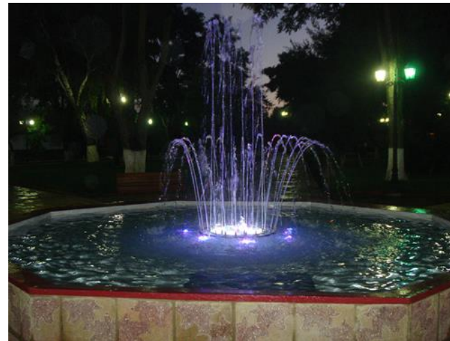
Figura N° 6 Plaza de Armas, Empedrado

Cada esquina de la plaza, indica un punto cardinal y es motivo de admiración por quienes visitan Empedrado. Últimamente se le ha estado arborizando con especies nativas, por lo que dentro de pocos años tendrá el atractivo de un jardín botánico ( https://bit.ly/34DRQ7f ).