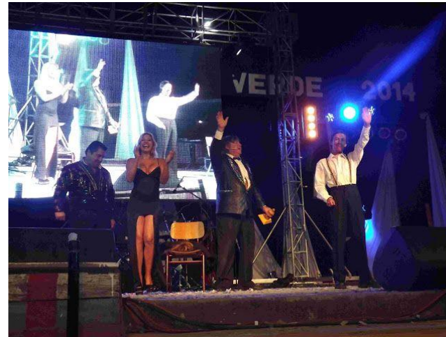
Figura N° 7 Fiesta del oro verde de Empedrado.

Actividad artística que se realiza todos los veranos en la segunda quincena de febrero. Se ha transformado en un evento reconocido a nivel regional y nacional debido a la calidad de sus espectáculos y los artistas que año tras año intervienen en él. Además, en la competencia musical participan cantantes de distintas ciudades del país. Este festival nació en 1987 por la necesidad de entregar a los habitantes de Empedrado y a sus visitantes un momento de agradable esparcimiento y entretenimiento, rindiendo a su vez un homenaje al pino (oro verde) (Servicio Nacional de Turismo, 2012).