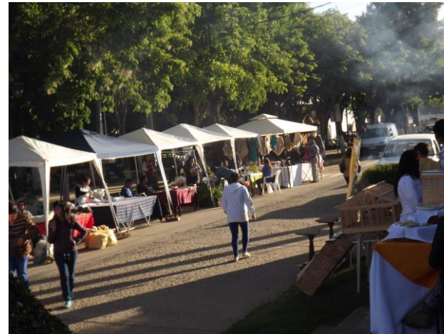
Figura N° 9 Feria de las Artes y la Cultura, Empedrado.

Organizada por el Centro Cultural de Empedrado y auspiciada por el Consejo Regional de la Cultura y las Artes, artesanos de diferentes disciplinas, grupos musicales y compañías de teatro, convergen en este espacio creado para el fomento de la cultura cada año en el mes de noviembre. ( https://bit.ly/3cfCdWr ).