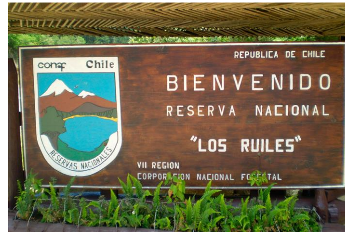
Figura N° 5 Reserva Nacional Los Ruiles, Empedrado

especie fue José Mercedes Jelves en su fundo El Porvenir, en la segunda mitad del siglo XVIII. El primero en Empedrado en interesarse por su estudio, fue el párroco Don Francisco Espinoza quien entregó todos los antecedentes por él recopilados a un botánico inglés, que llegó a Empedrado por el año 1959, con el objeto de estudiar este árbol que debería considerarse como símbolo del lugar ( https://bit.ly/34DRQ7f ).