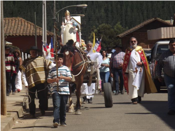
Figura N° 11 Festividad de la Inmaculada Concepción o de la Purísima, Empedrado.