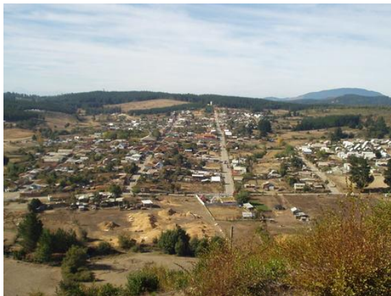
Figura N° 1 Empedrado.

El territorio donde se encuentra la comuna fue poblado desde el 4000 A.C. por indígenas picunches, a los que luego se agregó la colonización inca. En el año 1782, se creó en el mismo lugar el poblado de San José de Cuyuname. A raíz de un fuerte sismo en el año 1835, se autorizó la creación de una parroquia en el sitio de propiedad del señor Agustín Quintana, entonces inspector del sector de Junquillar, quien además inició las gestiones para rehacer el poblado, al cual se le dio el nombre actual de Empedrado. (Servicio Nacional de Turismo, 2012).