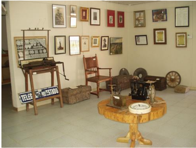
Figura N° 2 Museo de Arellano, Empedrado.